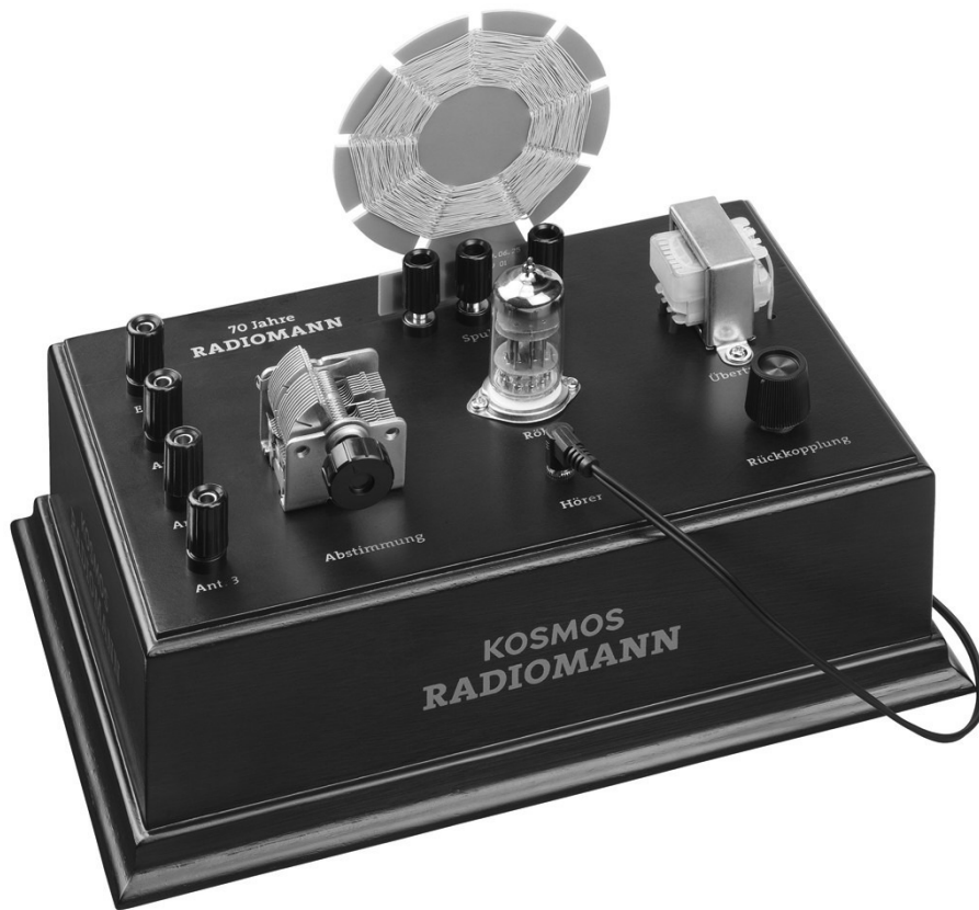
Bild 3.10 Der Kosmos-Radiomann mit Mittelwellenspule